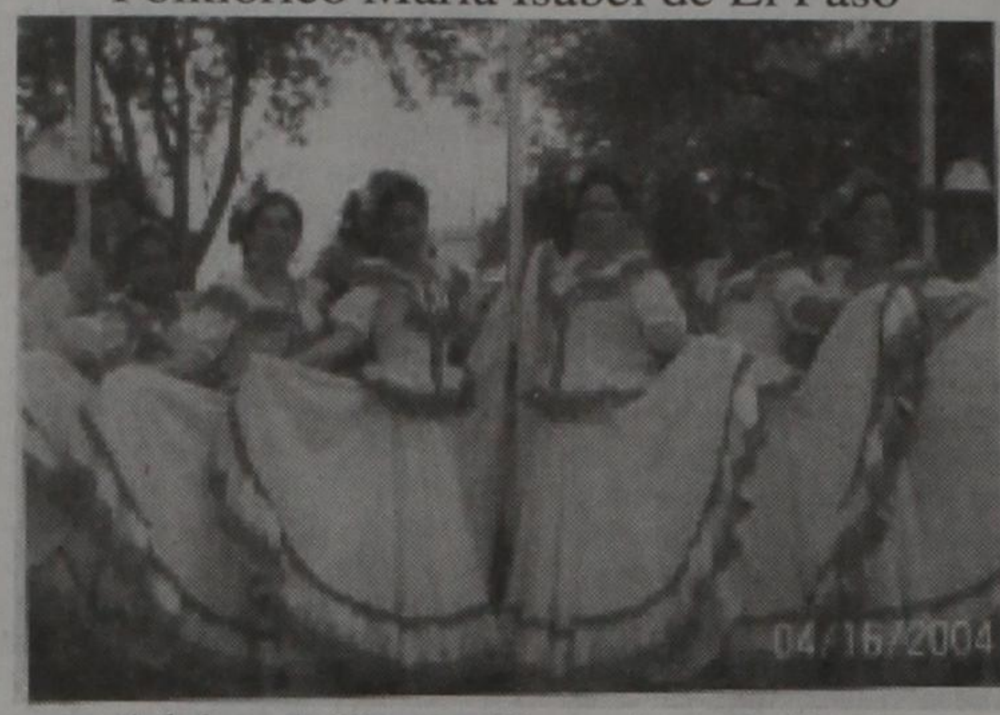
Adultos de Nuestra Herencia de Lubbock