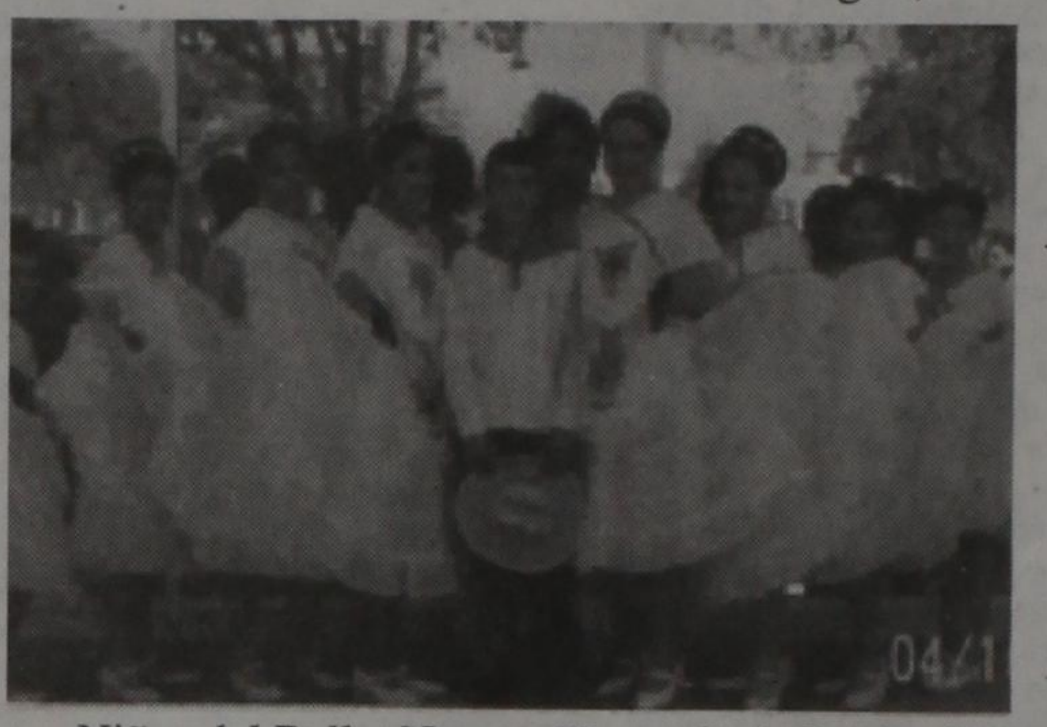
Niños del Ballet Nuestra Herencia de Lubbock