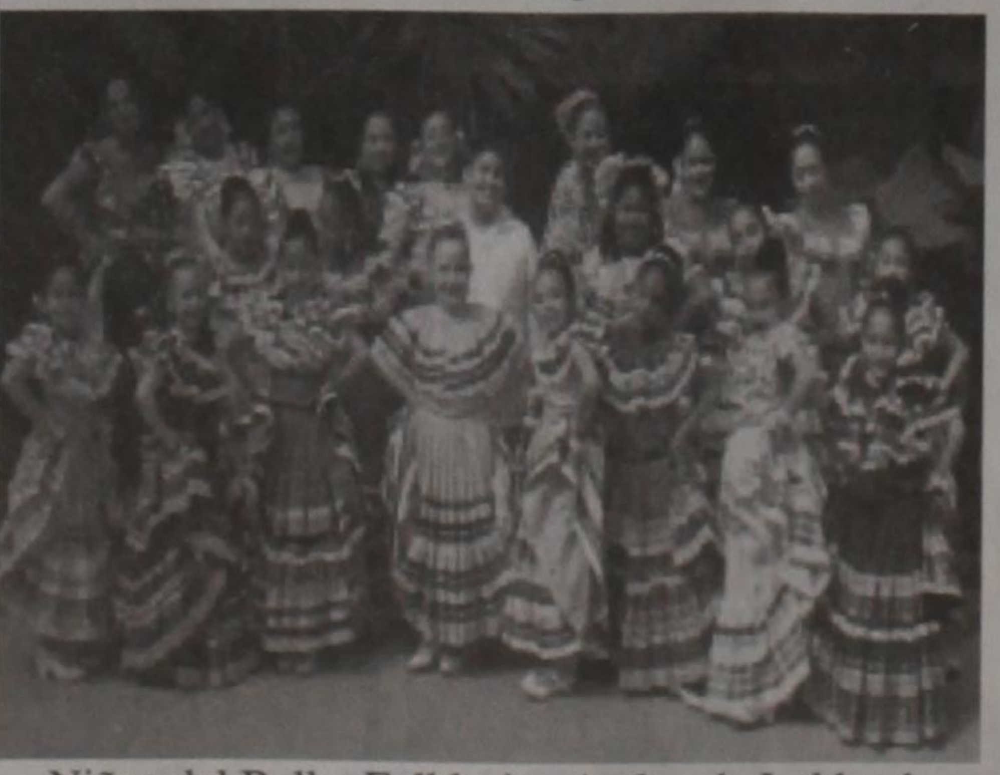
Niños del Ballet Folklorico Aztlan de Lubbock