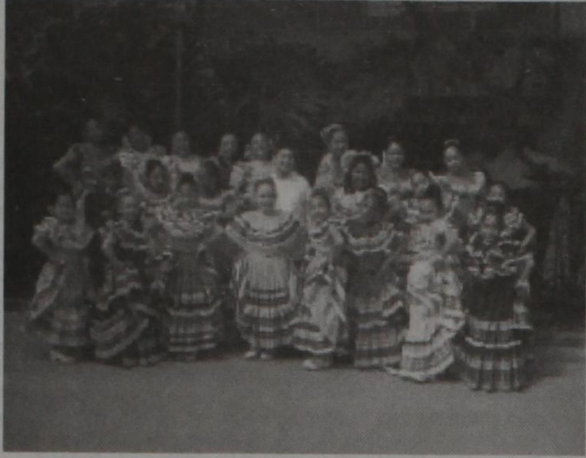
Ballet Folklorico Aztlan de Lubbock

El publico es invitado a participar a las actividades empesando el Viernes y continuando hasta el Sabado por la noche. Aqui en esta pagina de El Editor presentamos el horario al igual de lotos fotos de aglunos de los Ballets quien participaran. ¡No falte a las activiades!