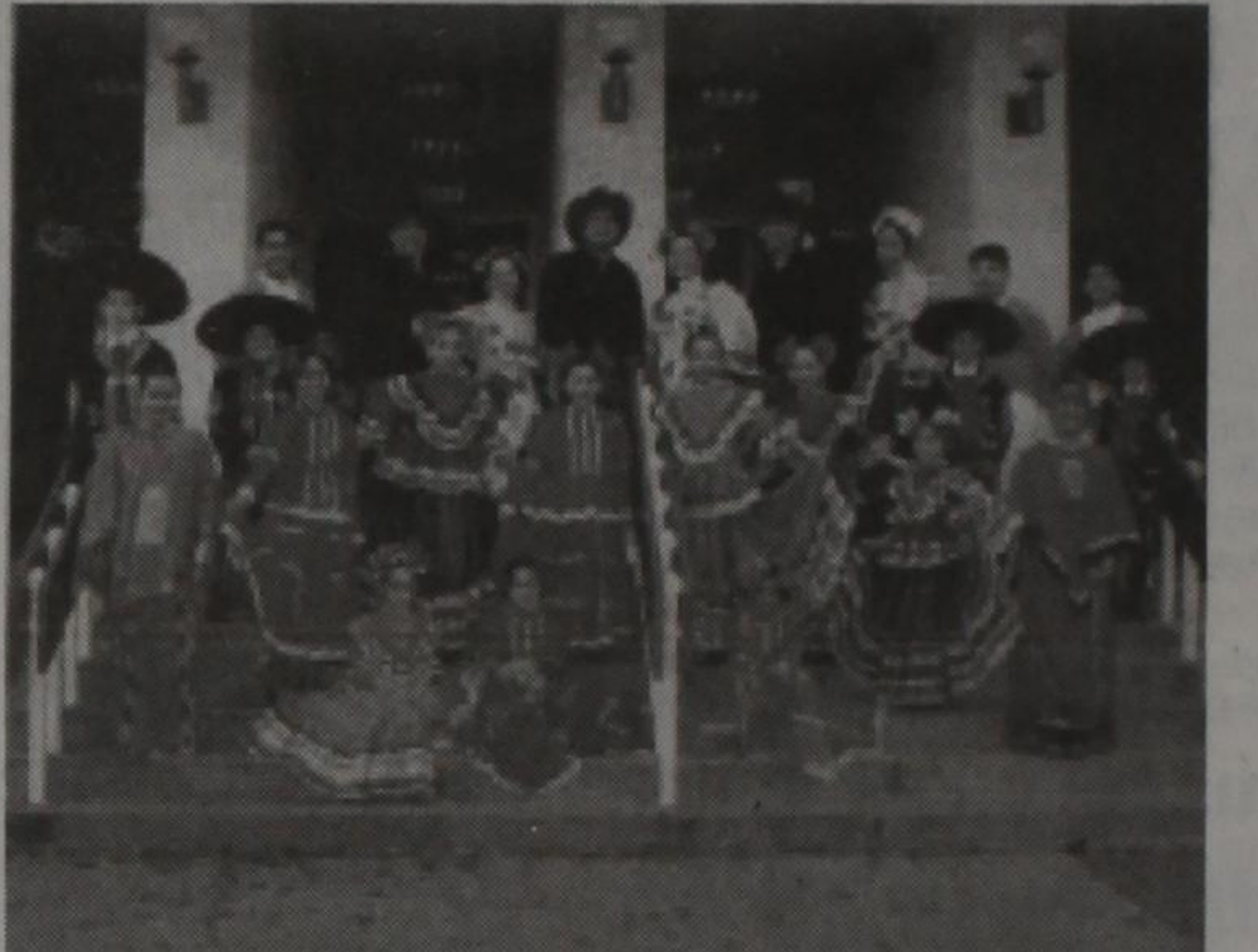
Ballet Folklorico Guadalupe de Snyder