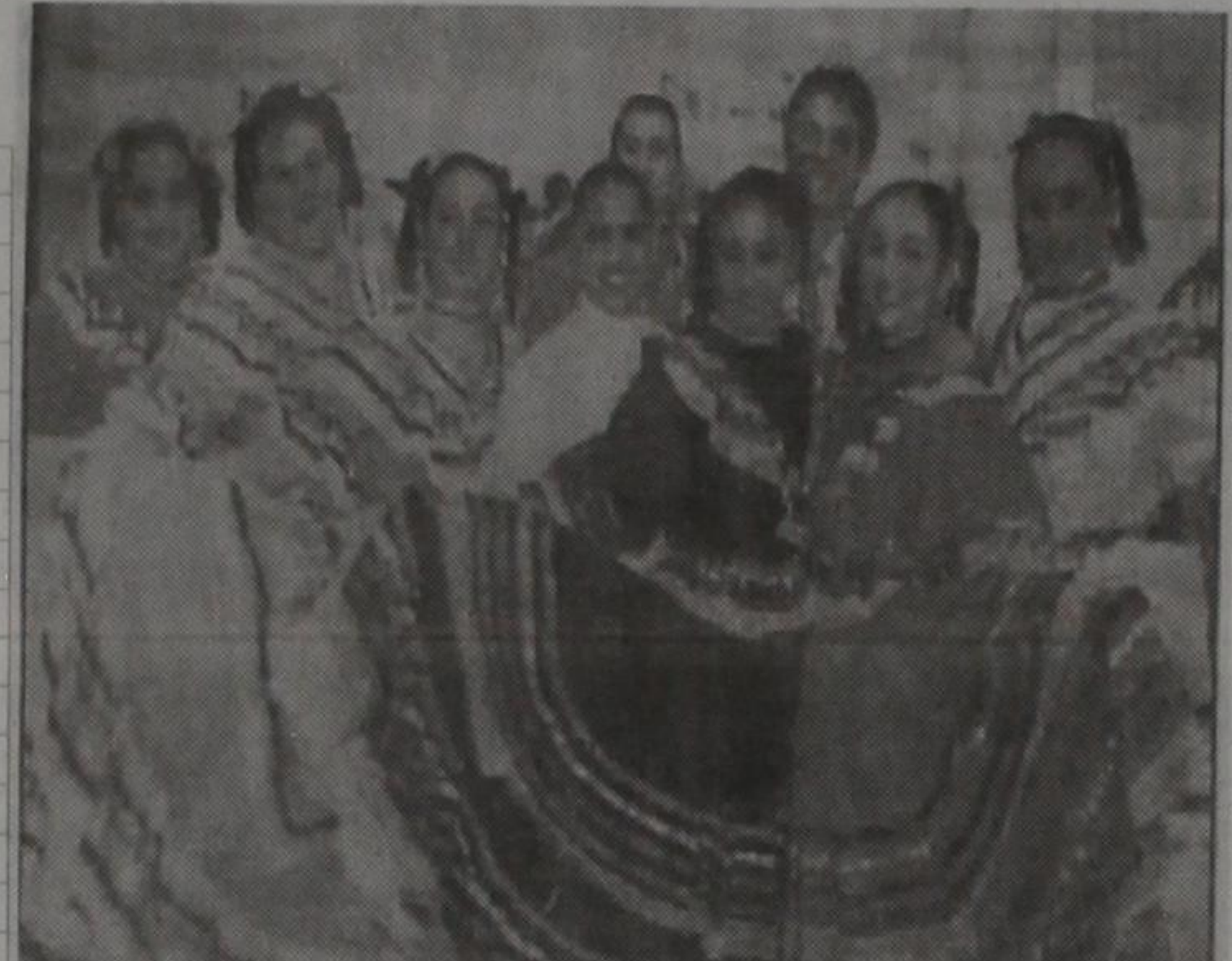
Santa Maria High Scho de Pomo California