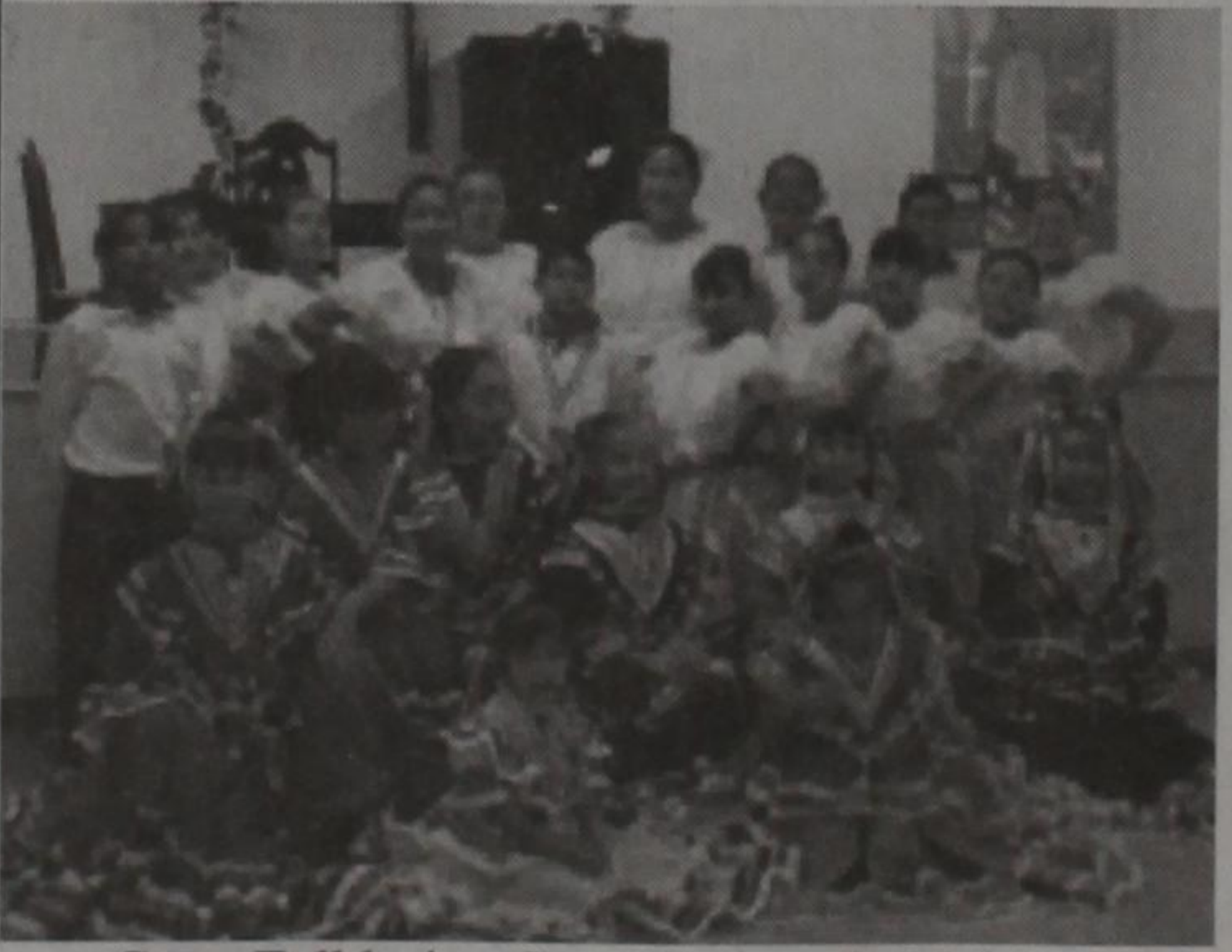
Gupo Folklorico Guadalupano de Mulshoe