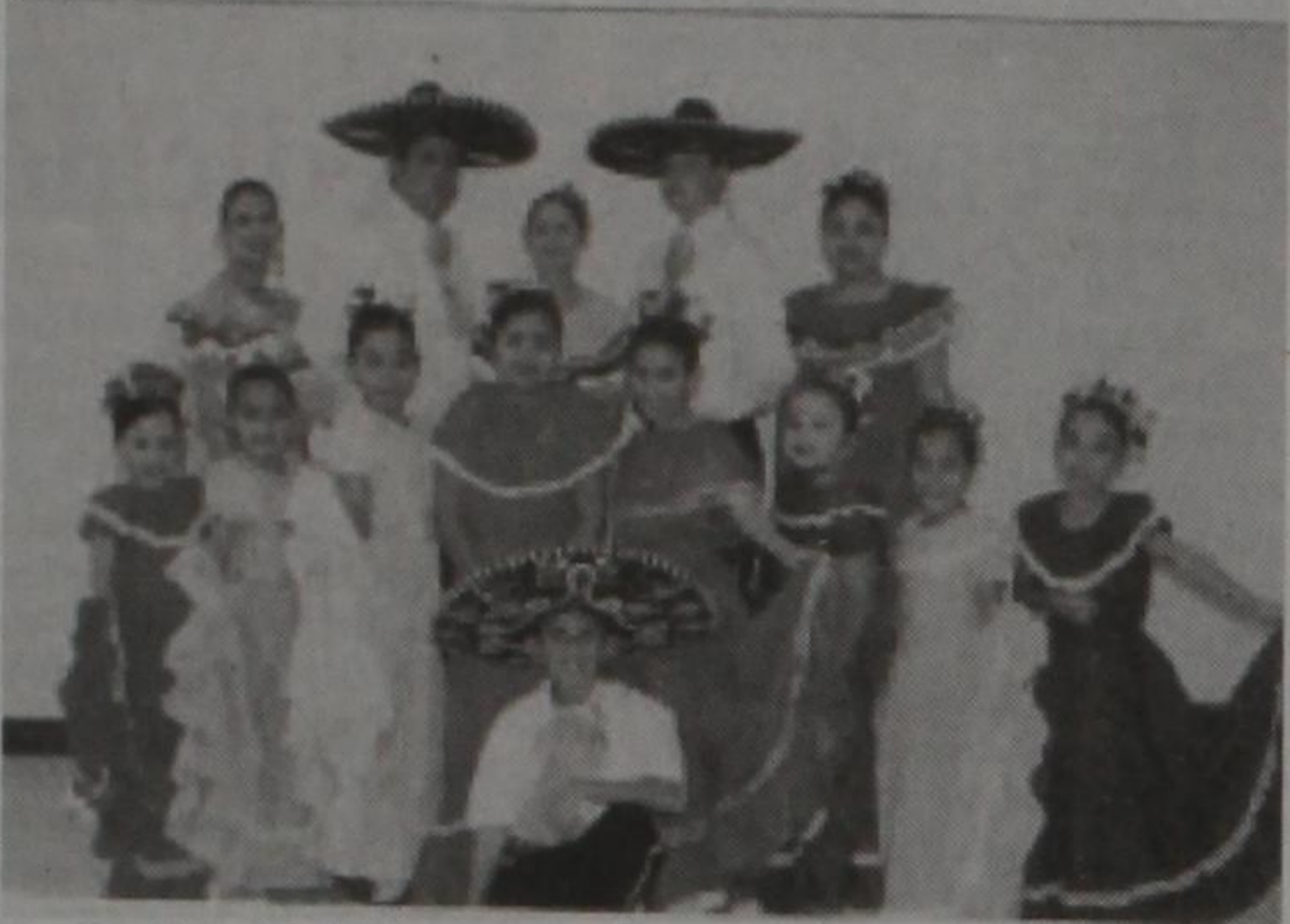
Ballet Folklorico Paloma Libre de Lorenzo