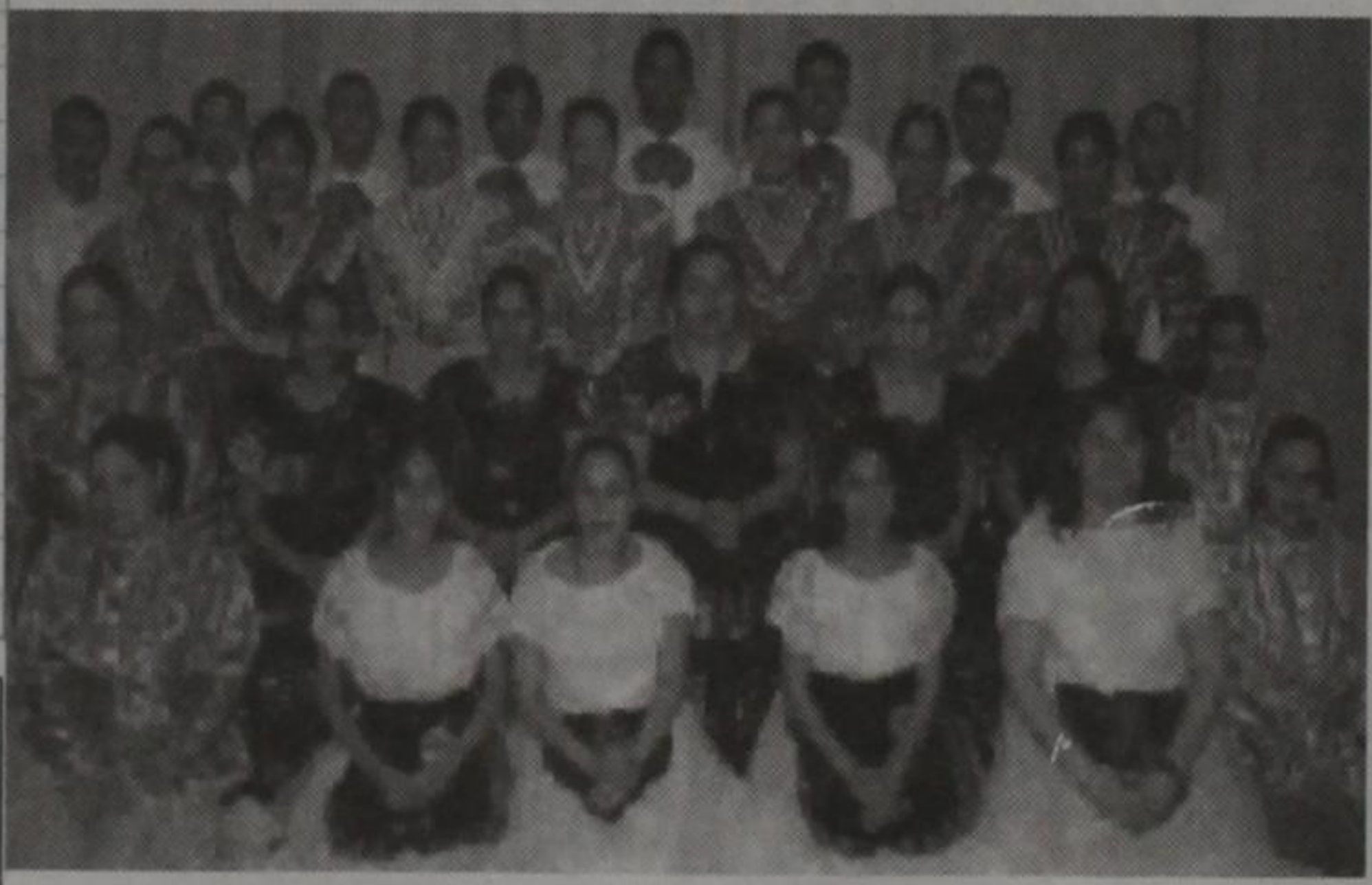
Alma Folklorica de Guymon Oklahoma