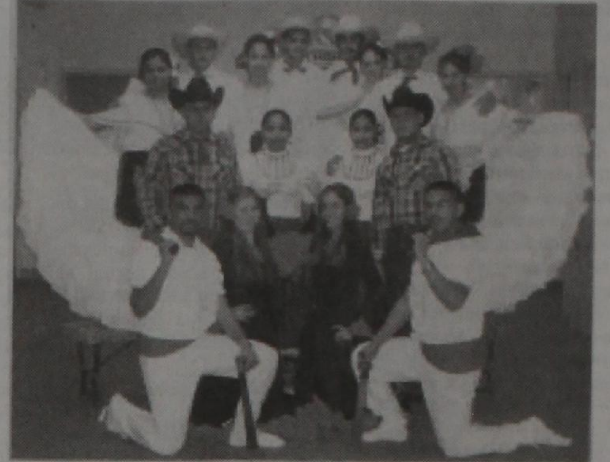
Paisano Ballet Folklorico de Terlingua,