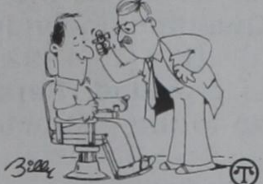
Regular professional eye examinations can help save vision by detecting retinal tears at an early stage.