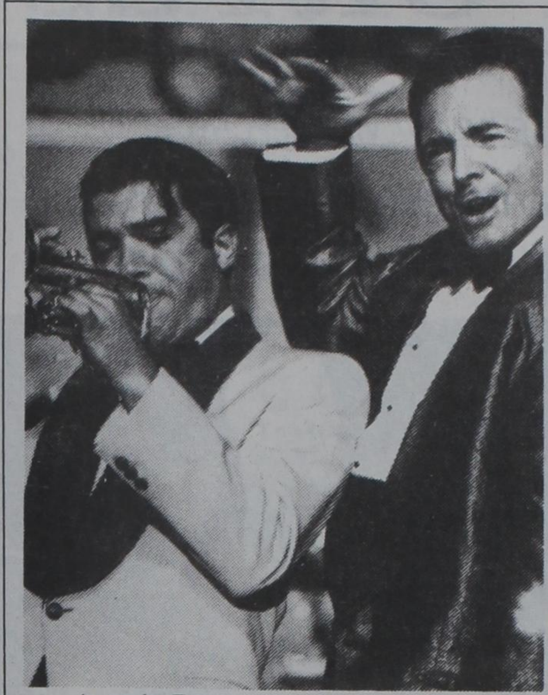
Antonio Banderas y Armando Assante.

México, Notimex- El grupo mexicano "Los Reyes del Mambo" interpuso dos demandas contra la compañía productora estadounidense "Warner Brothers" por el uso ilegal de su nombre en la cinta que protagonizan Armand Assante y Antonio Banderas.