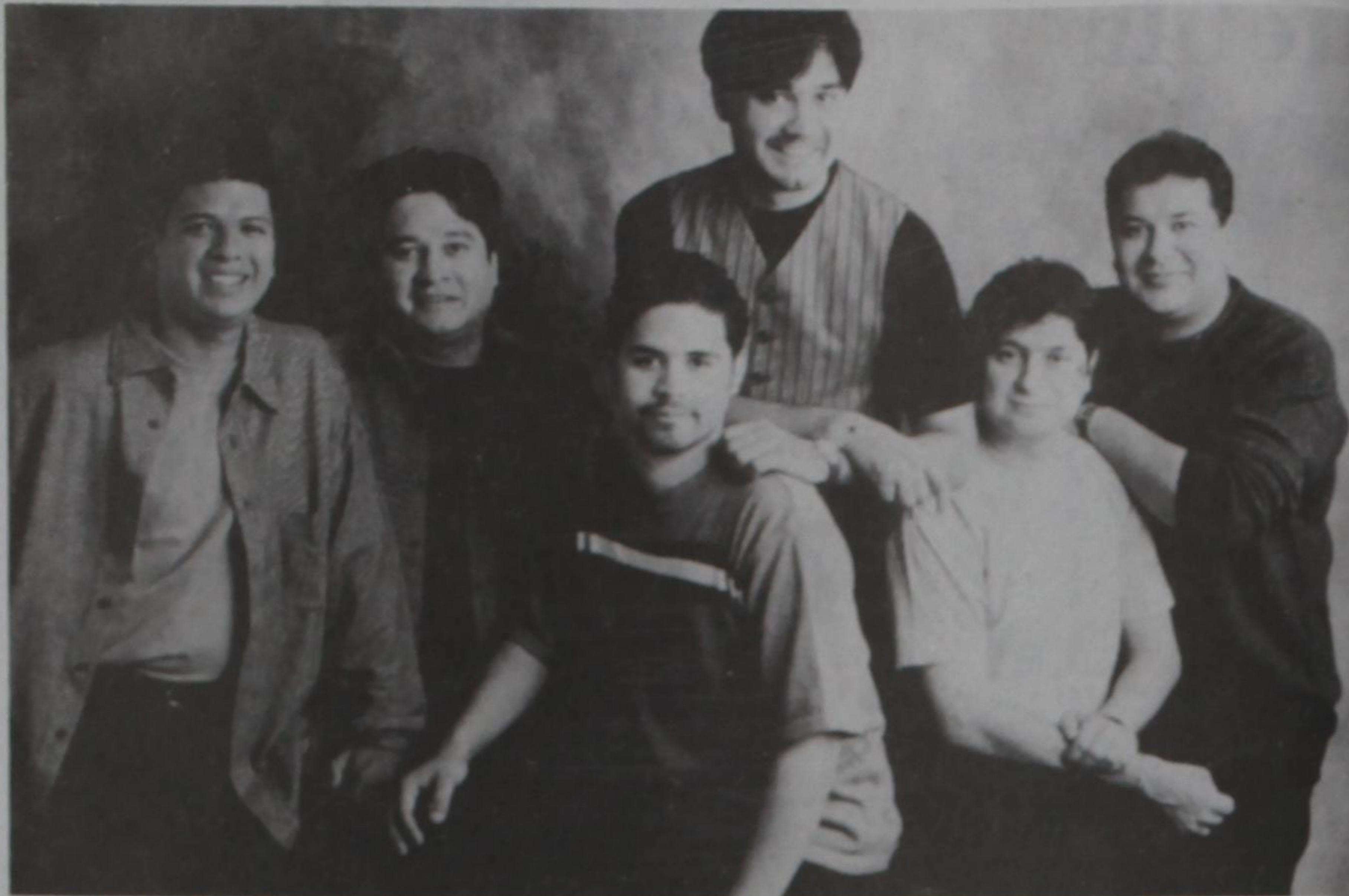
La Mafia will be featured at the 5 de Mayo Tejano Concert on Sunday