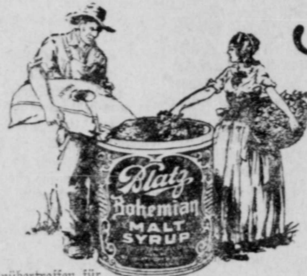
Unübertroffen für Kochen, Backen, Candy-Machen