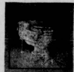
Patented and Patents Pending.