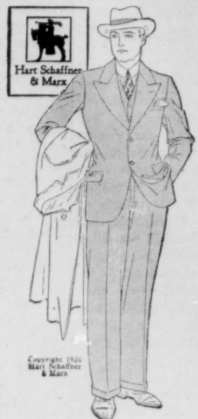
Hart Schaffner & Marx Copyright 1925 Hart Schaffner & Marx