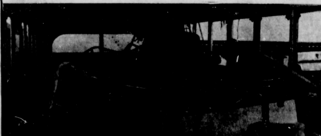
El interior del camion fatal después de ser sacado del canal de drenaje muestra los asientos donde los 19 fueron atrapados y ahogados. Los asientos fueron amarrados con tornillos de menos de medio pulgada—el piso era tan delgado que un solo filete de tornillo aseguraba el asiento.

...Compañeros y compañeras, estos hombres y mujeres que han perdido sus vidas son seres humanos de gran valor. Seres humanos porque somos unos de los otros, nos apreciamos unos a los otros, nos amamos unos a los otros.