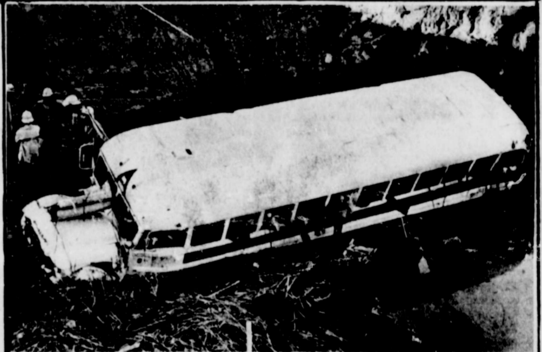
Este canal de drenaje sin señal, sin contracarril, donde murieron 19 trabajadores campesinos, es casi invisible de 100 pies de distancia.